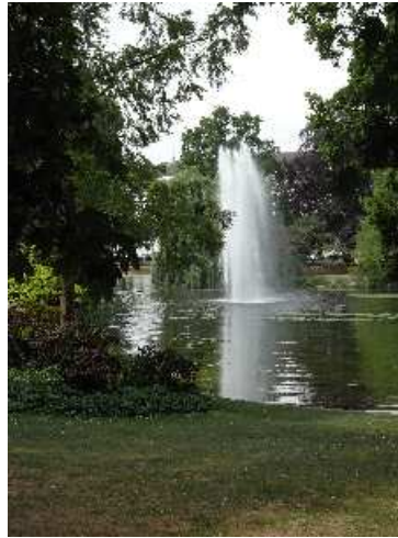
Park am Kurhaus in Wiesbaden, Mai 2011

Als erstes befreie den Geist von allen Sorgen und Vorstellungen. Lasse den Geist still werden und komme zur Ruhe in dir selbst . Sei dir bewusst, wo du jetzt bist. Fühle, wie deine Füße den Boden berühren. Fühle das Gewicht des Körpers auf dem Stuhl. Fühle, wie die Kleider die Haut berühren und wie die Luft im Gesicht und an den Händen spielt. Falls die Augen offen sind, lasse sie Farbe und Form ohne Kommentar aufnehmen. Schmecke. Rieche. Sei völlig gegenwärtig. Jetzt sei dir des Hörens bewusst. Lausche den Geräuschen und lasse sie lauter und leiser werden ohne Kommentar oder Urteil. Mit völlig entspanntem Körper lasse das Hören alles erfassen bis zu den entferntesten und leisesten Geräuschen, nimm sie alle auf.